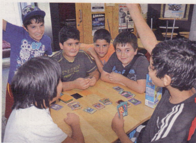
Die Kinder konnten das Programm während der Ferienbetreuung selbst bestimmen. Kartenspiele gehörten auch dazu

Nach dem Erfolg im vergangenen Jahr hat der Förderkreis des Kinder- und Jugendhauses in Hausen auch diese Sommerferien wieder eine Ferienbetreuung angeboten. Knapp 30 Besucher konnten jeden Tag begrüßt werden.